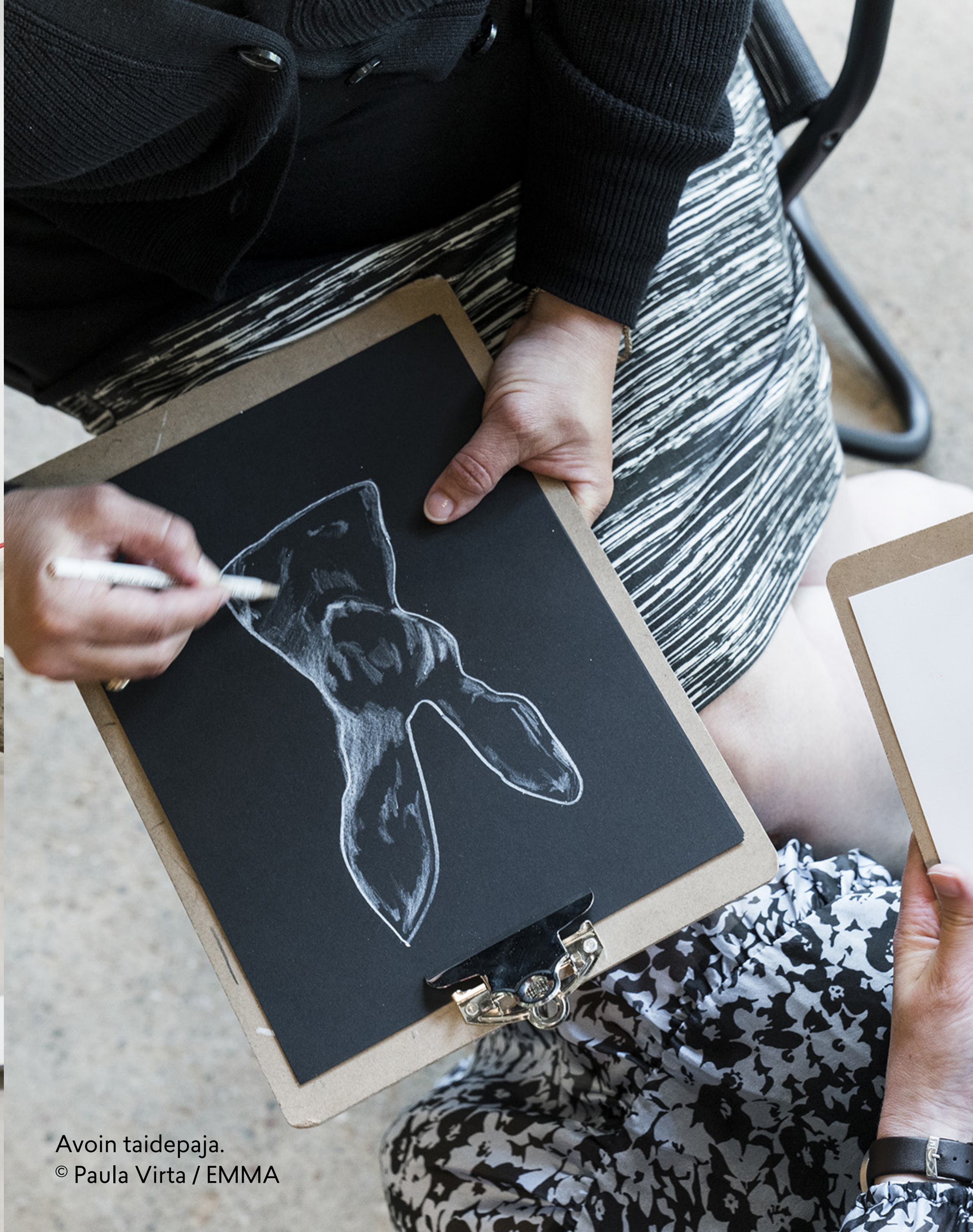
Avoim taidepaja.