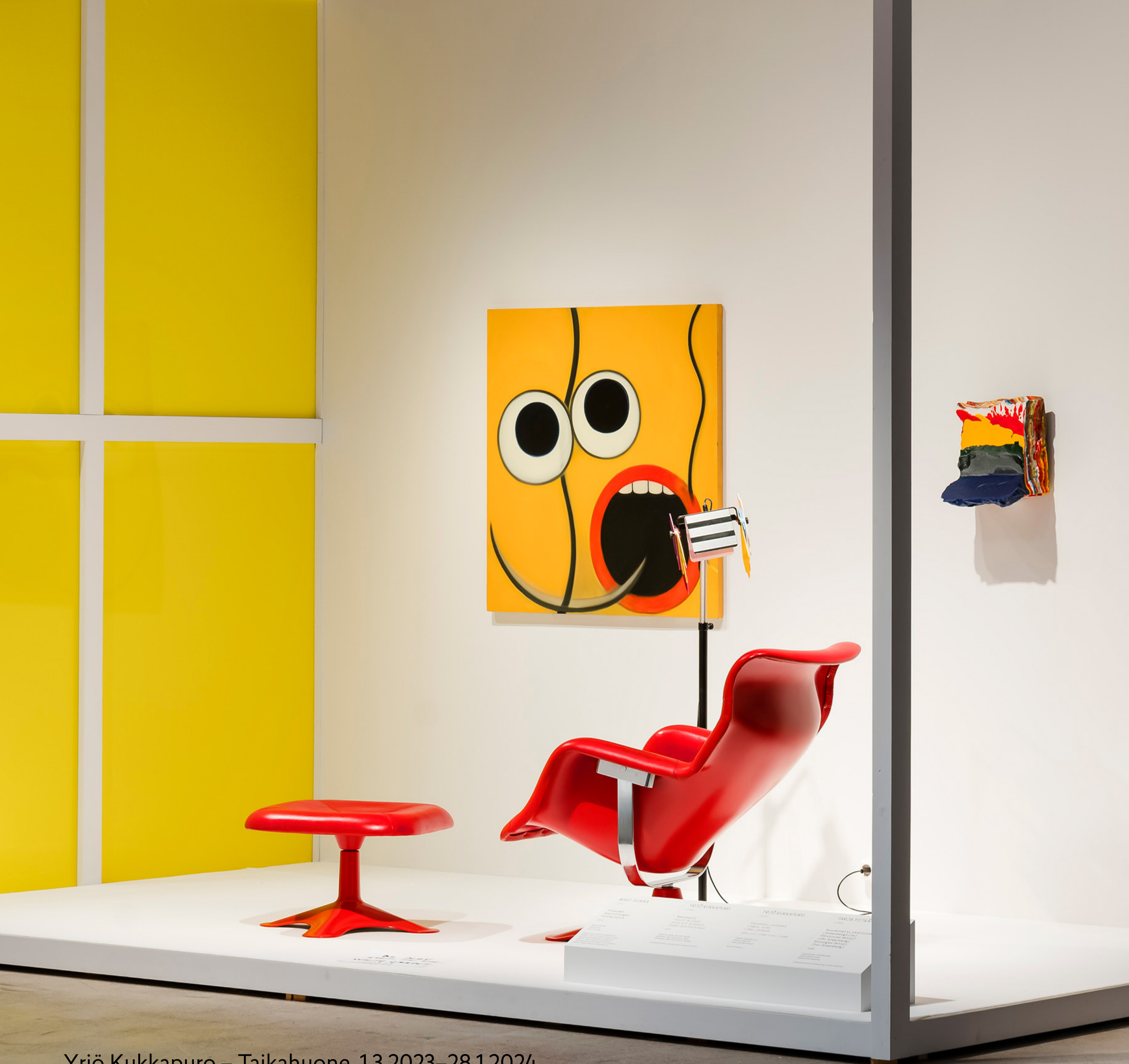
Yrjö Kukkapuro – Taikahuone, 1.3.2023–28.1.2024