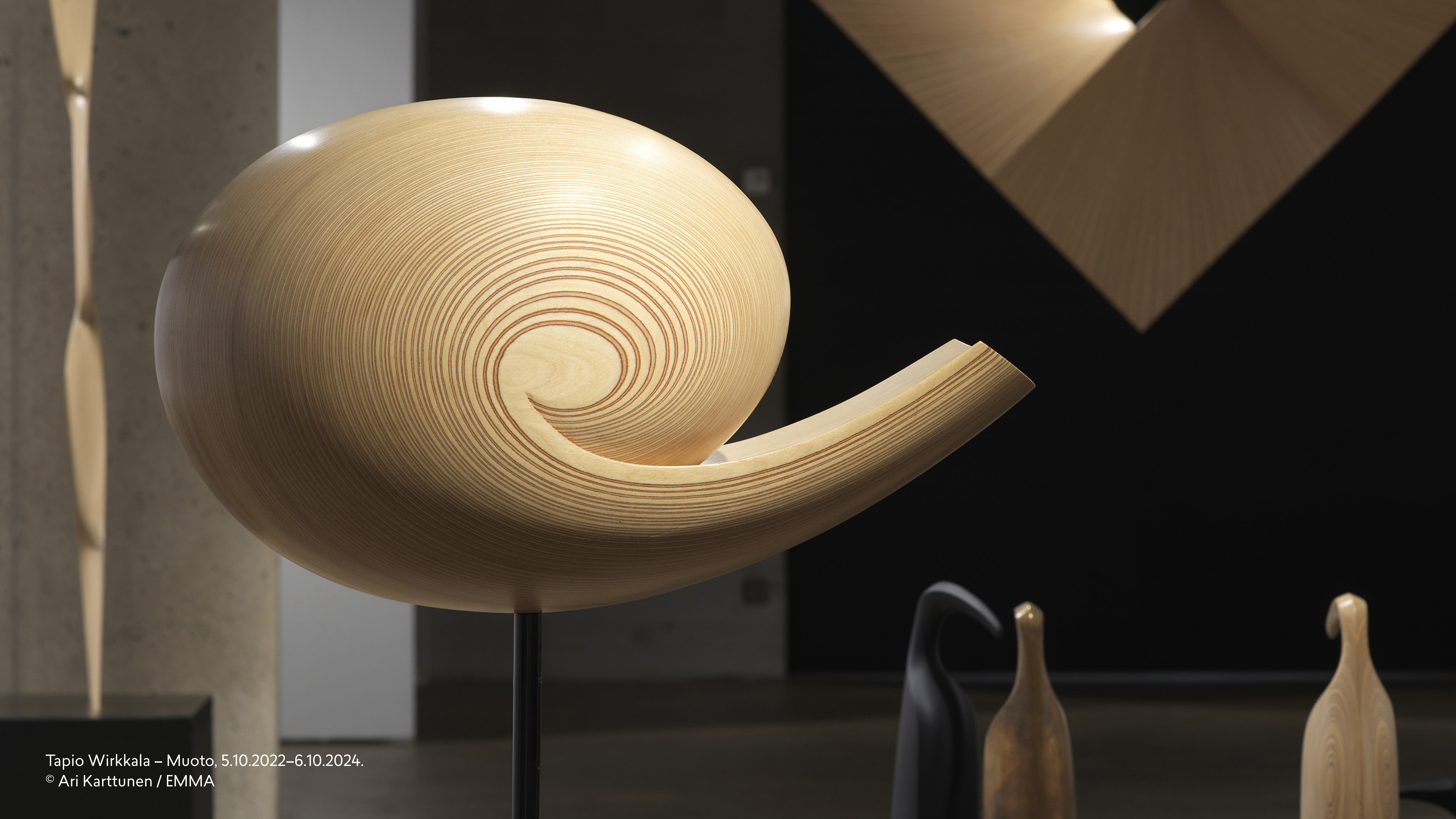
Tapio Wirkkala – Muoto, 5.10.2022–6.10.2024.