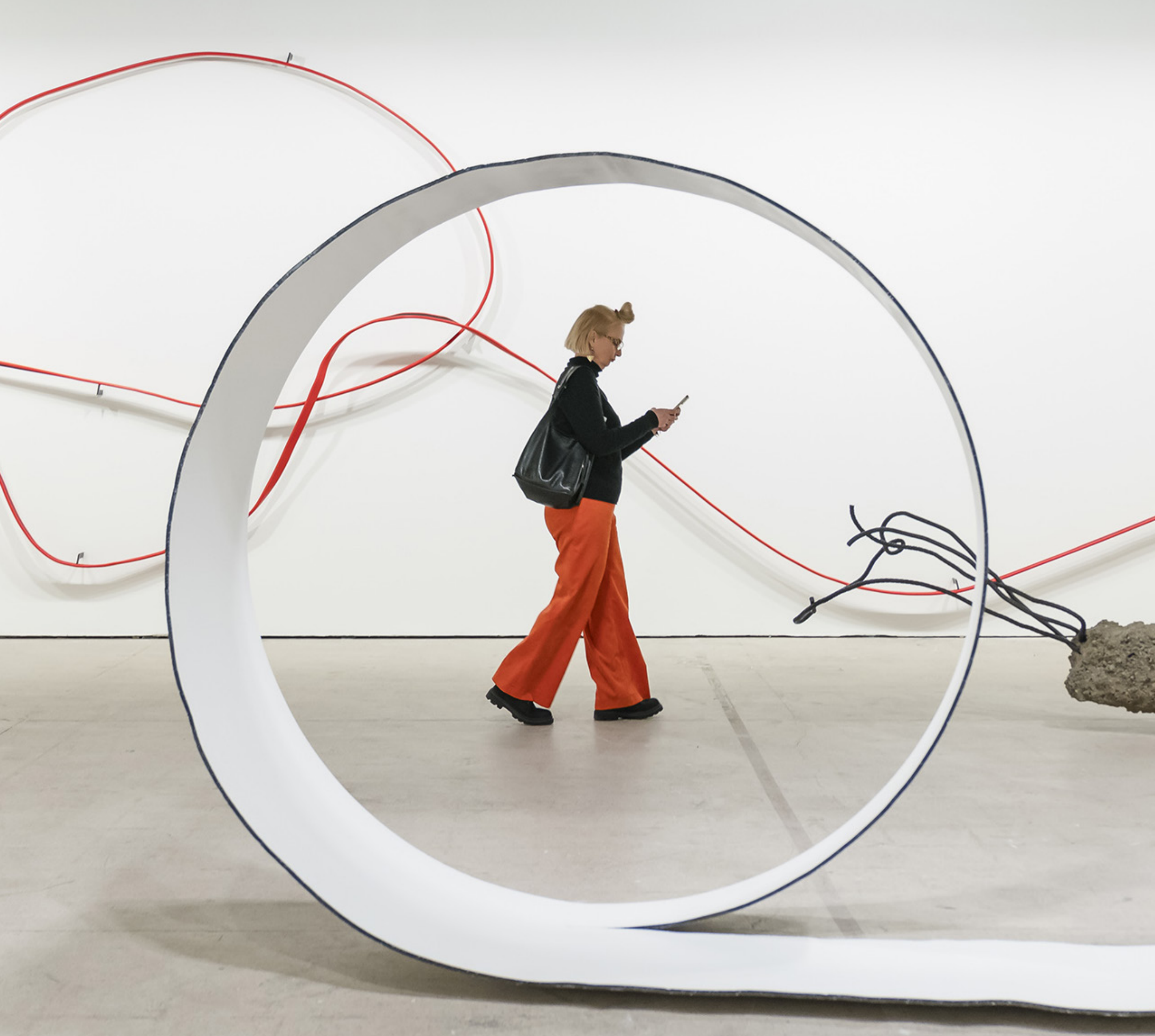
Monika Sosnowska: An Order Apart, 6.3.–15.12.2024.