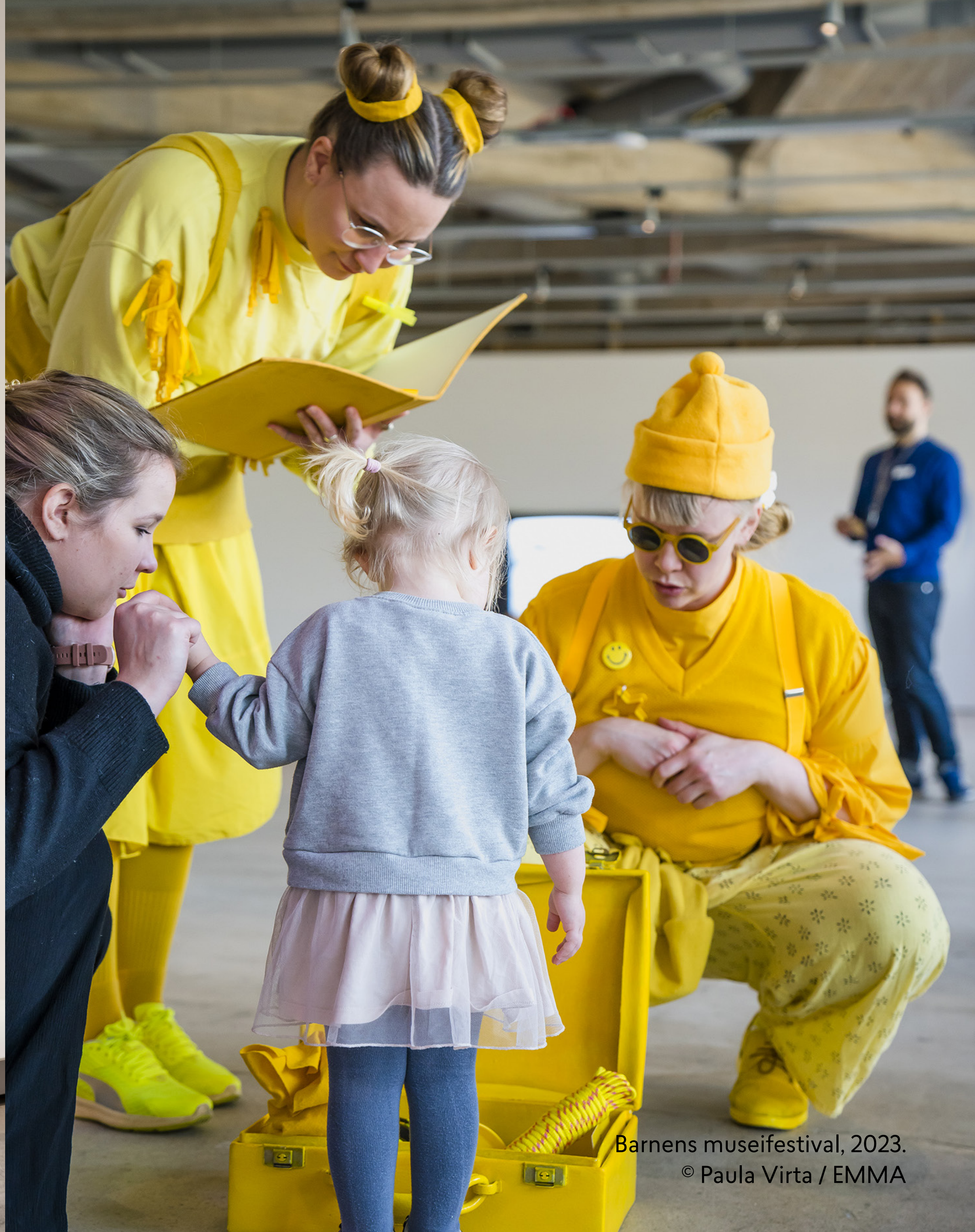
Barnens museifestival, 2023.