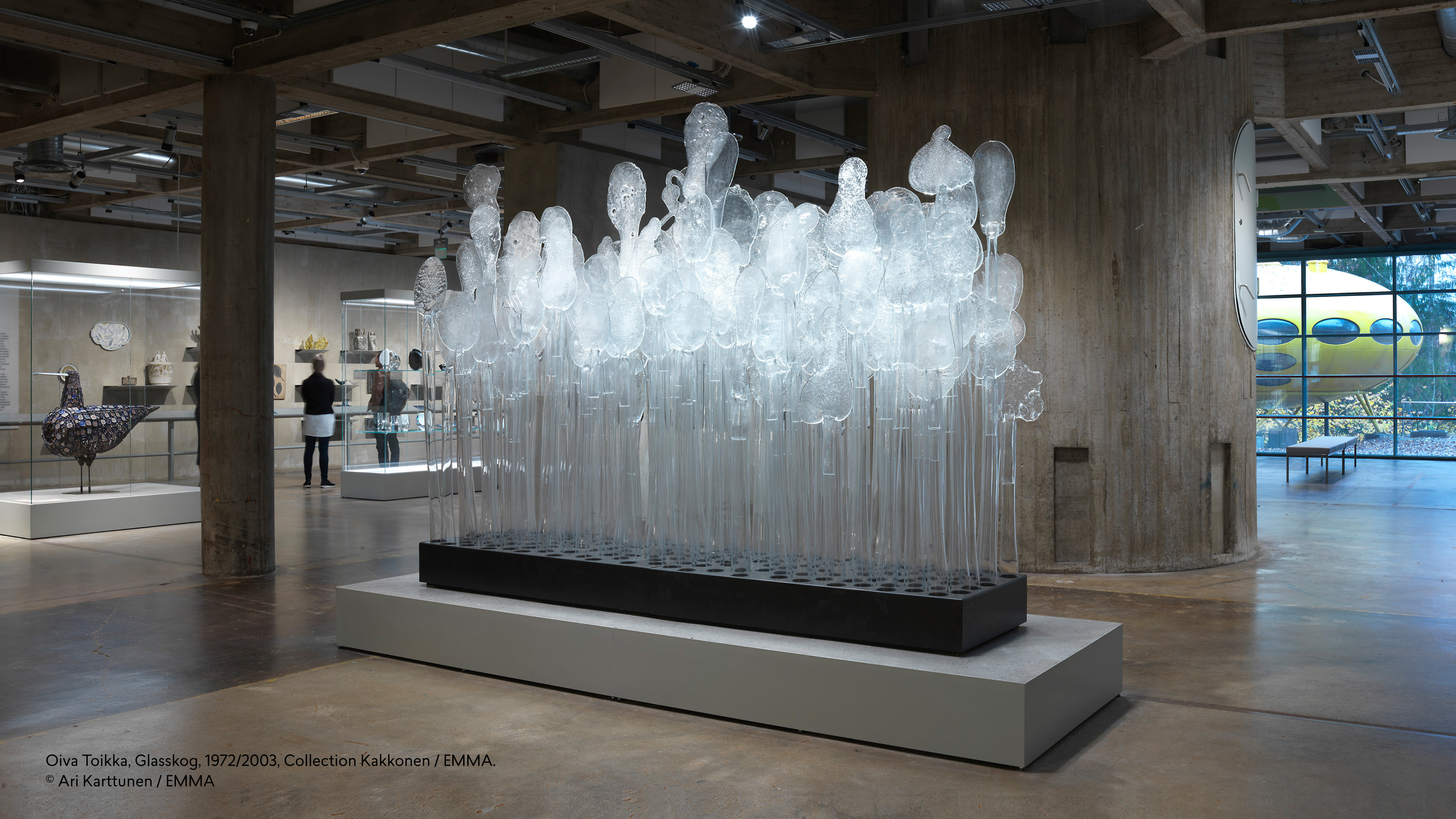
Oiva Toikka, Glasskog, 1972/2003, Collection Kakkonen / EMMA.