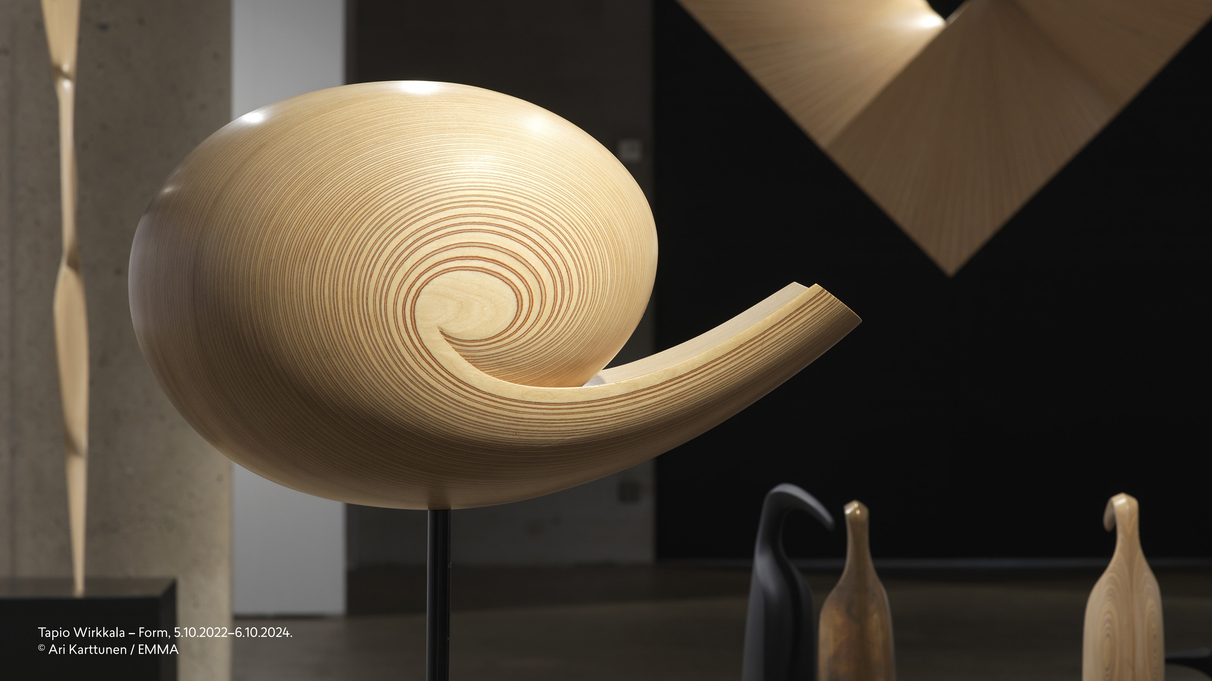
Tapio Wirkkala – Form, 5.10.2022–6.10.2024.