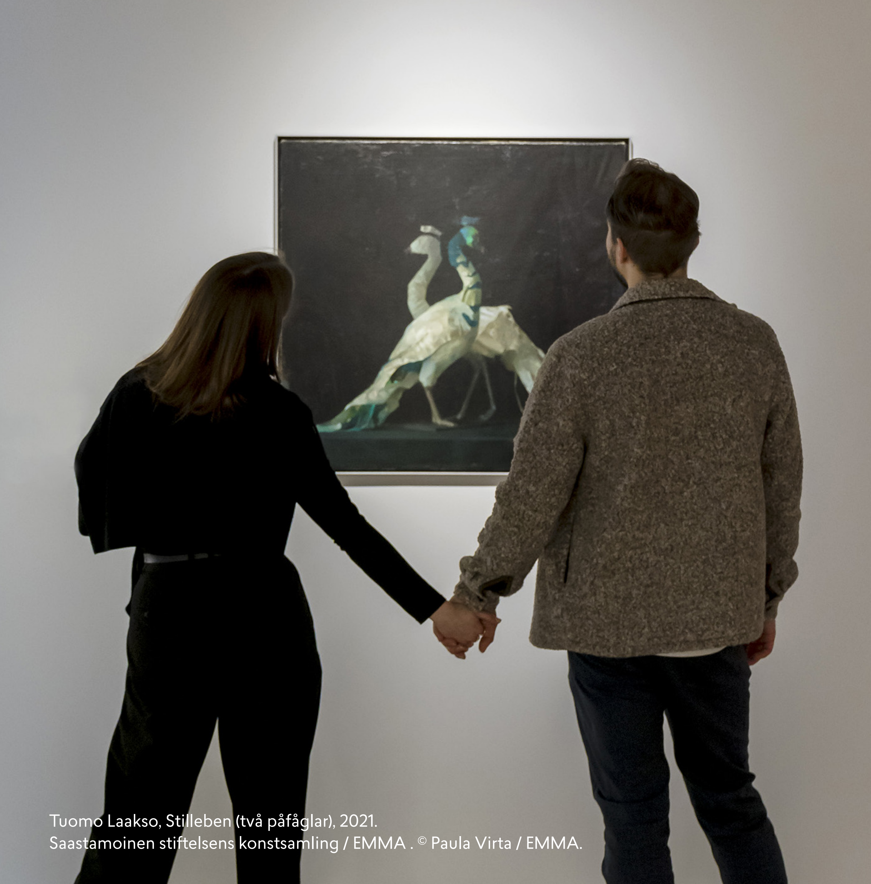
Tuomo Laakso, Stilleben (två påfåglar), 2021. Saastamoinen stiftelsens konstsamling / EMMA .