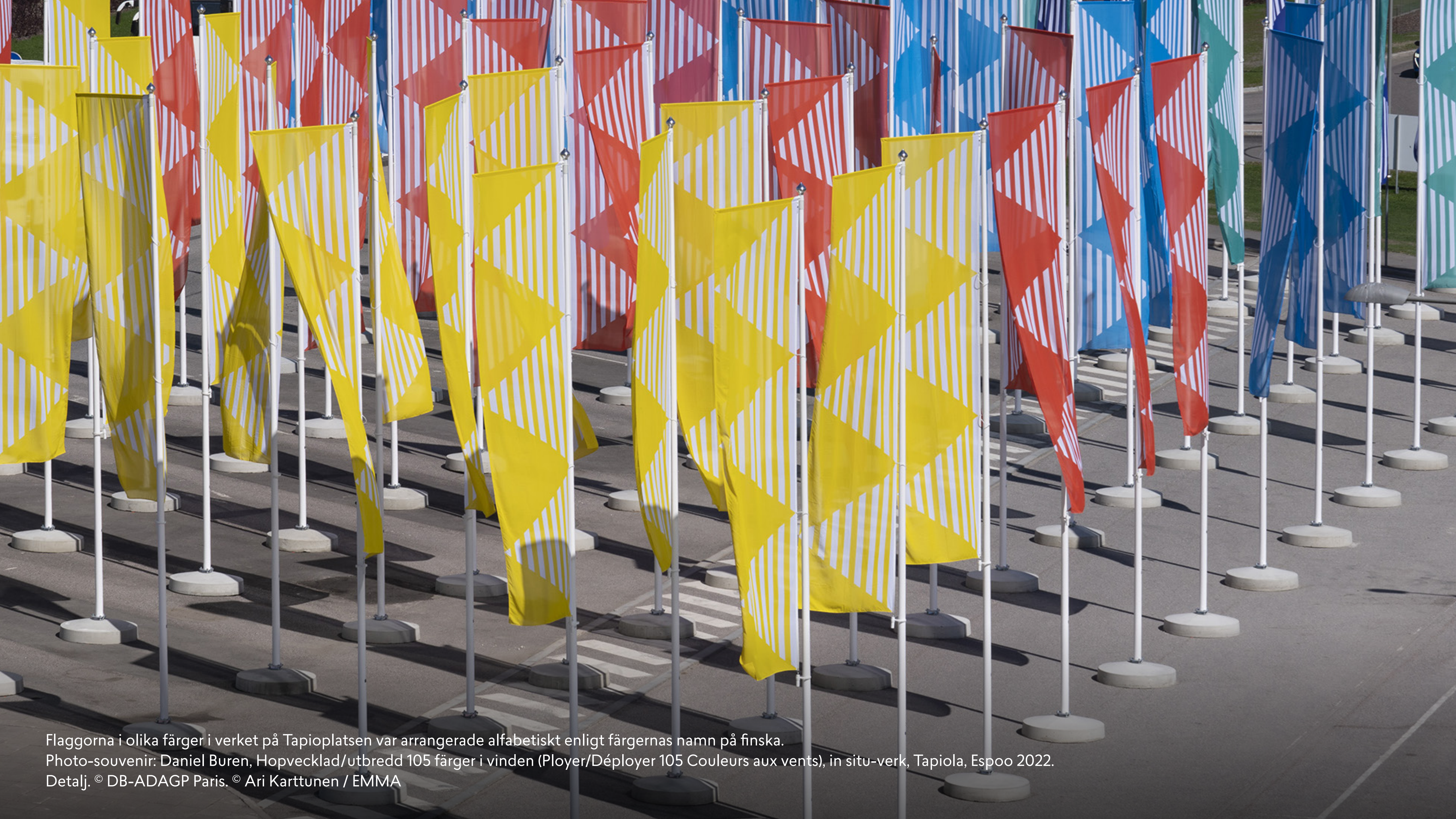
Flaggorna i olika färger i verket på Tapioplatsen var arrangerade alfabetiskt enligt färgernas namn på finska. Photo-souvenir: Daniel Buren, Hopvecklad/utbredd 105 färger i vinden (Ployer/Déployer 105 Couleurs aux vents), in situ-verk, Tapiola, Espoo 2022. Detalj. © DB-ADAGP Paris.