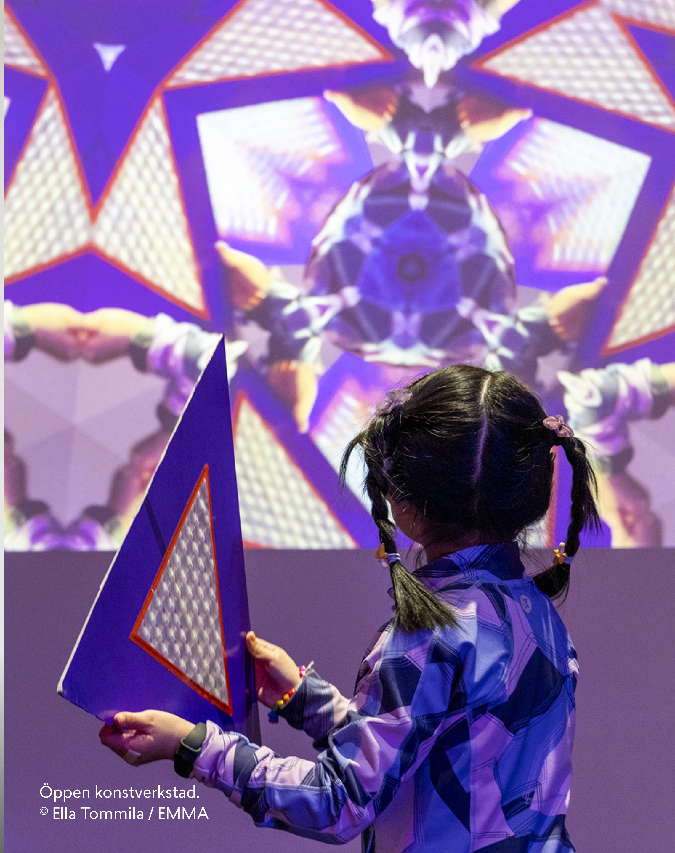
Öppen konstverkstad.