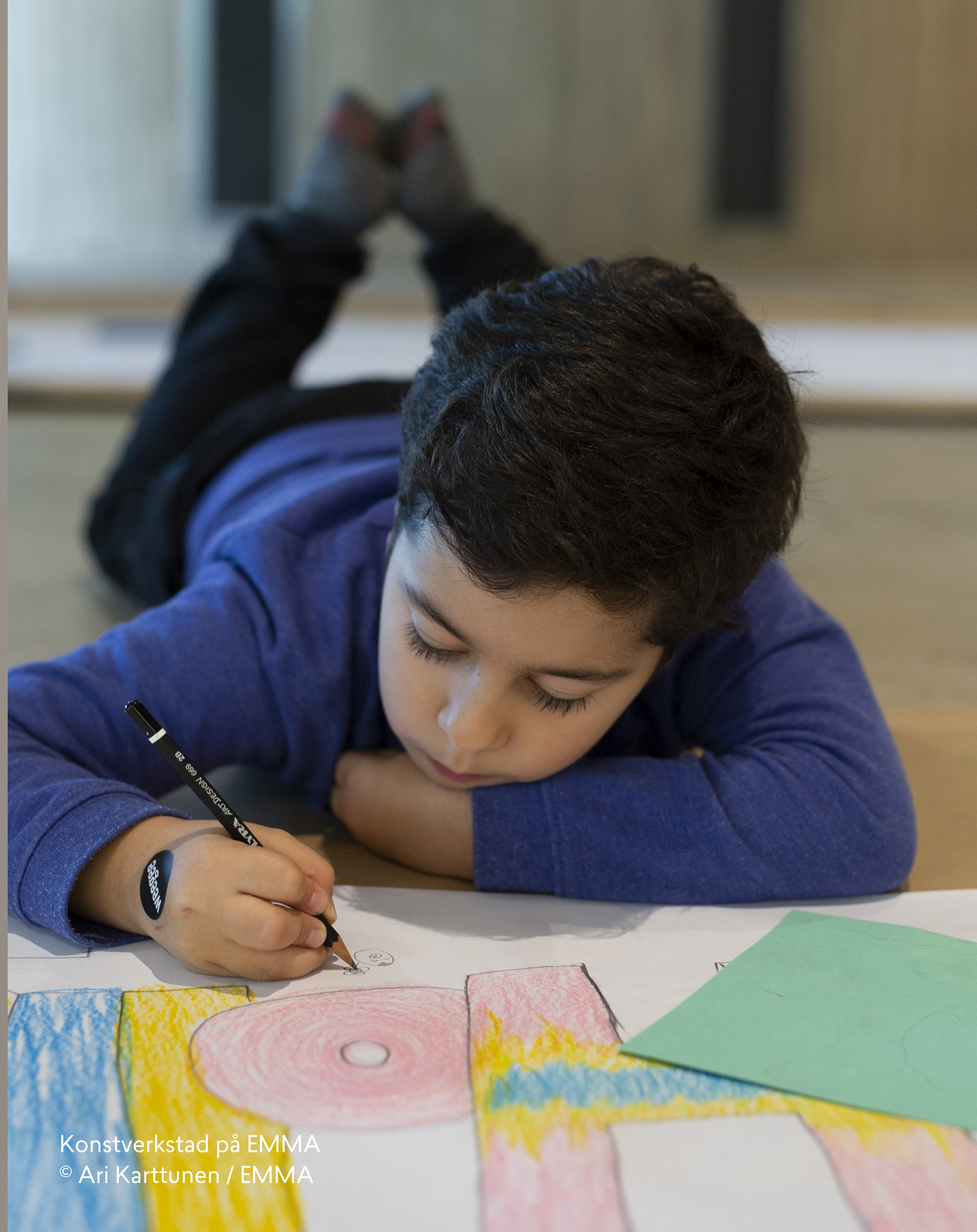
Konstverkstad på EMMA