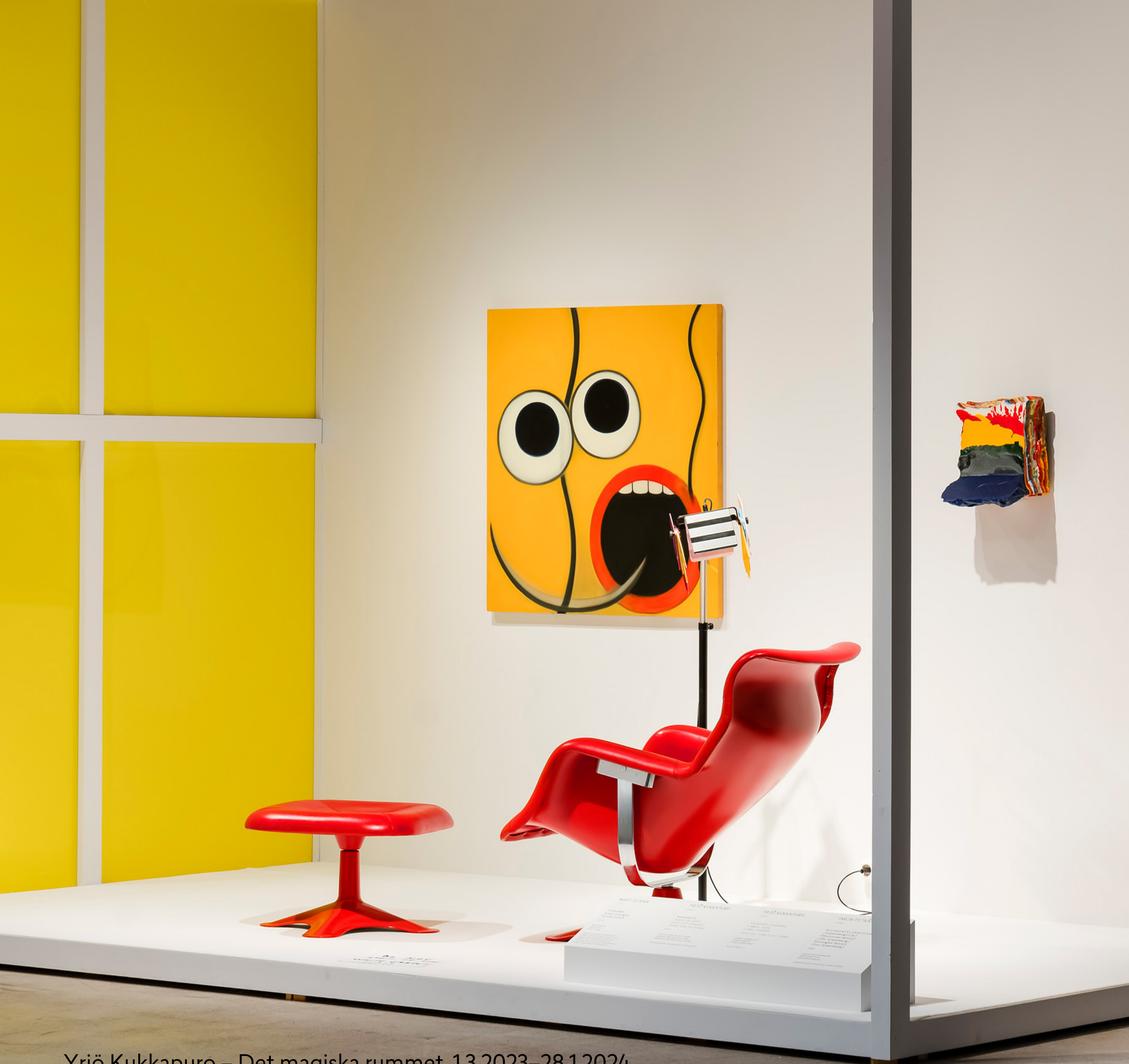
Yrjö Kukkapuro – Det magiska rummet, 1.3.2023–28.1.2024